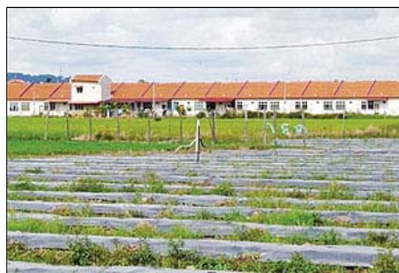
Pertanian di kawasan perumahan sewajarnya digalakkan bagi menampung keperluan sumber makanan.

Makanan yang dihasilkan dalam bandar mendekati sumber makanan dengan penduduk bandar.